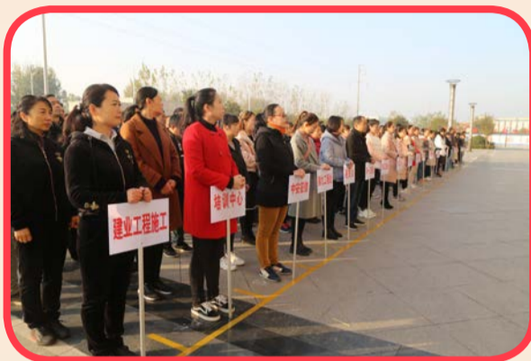
整齐划一的各单位代表队