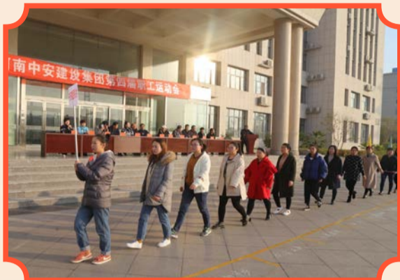
各单位代表队接受集团公司领导检阅