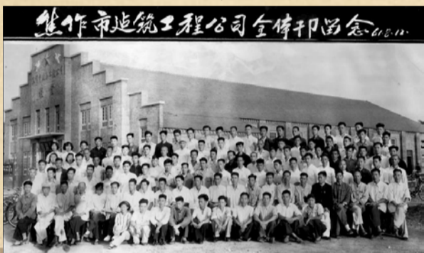
● 1962年11月1日，焦作市建筑服务站改为 焦作市建筑工程公司 。

● 1964年，由焦作市建筑工程公司第一次标准图设计施工，第一次用砼预制梁、柱、板等构件和轻型钢屋架的 河南轮胎厂103、104仓库 开工。