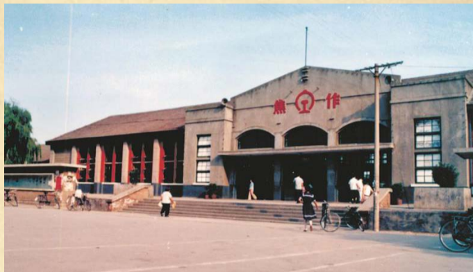
● 公司承建的 焦作老火车站 1966年竣工。

● 1966年8月25日，公司改为 河南省豫北建设公司第四工程处 ；是年，由公司承建的新 电铝厂 建成，是焦作市当时最长的厂房。