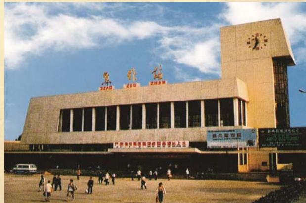
● 公司承建的 焦作新火车站 1988年竣工。

● 1968年，撤销豫北建设公司第四工程处，恢复 焦作市建筑工程公司 原称，系地方国有企业。