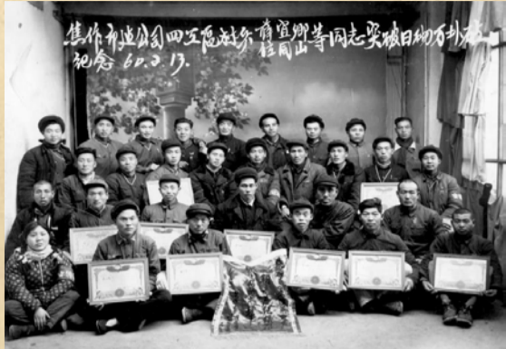
● 1960年公司四工区突破日砌万块砖标兵留影。