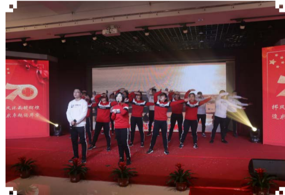
合唱 《强国一代有我在》