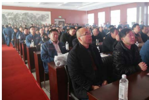
现场嘉宾看得津津有味