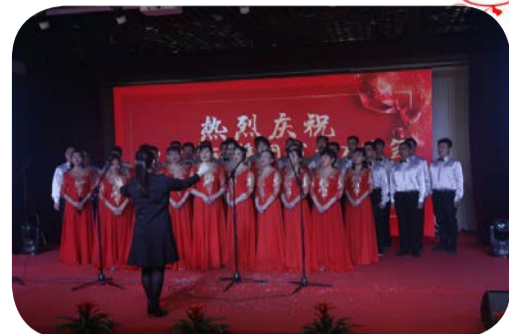
合唱 《中安建设之歌》