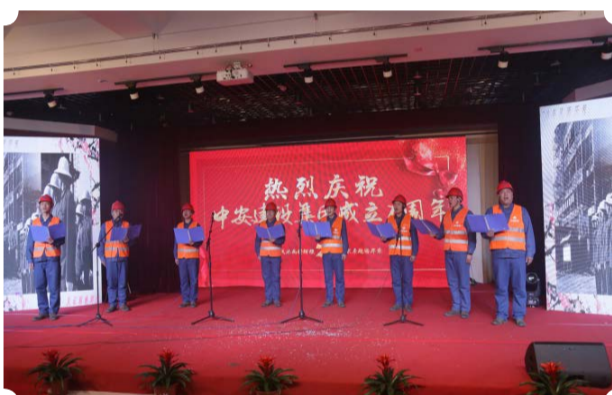
诗朗诵 《遇见美好的你—我们的中安》